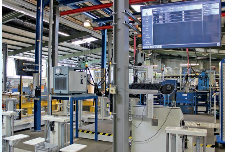
Anfang und Ende der KNOLL-Montageanlage bei HAP: Links im Vordergrund ist die Startstation zu sehen, an der das RFID-Tag mit dem Auftrag beschrieben wird, rechts die Entnahmestation. Der Monitor stellt unter anderem die Sequenz dar, in der die LKW-Querträger in die Transportbehälter geladen werden.

und über Indexier-Dorne in eine definierte, wiederholbare Position bringt. Während jetzt noch der Mitarbeiter den IO-Zustand mit einer Zustimm taste quittieren muss, erfolgt dann die Freigabe automatisch, da die Messzelle mit der Steuerung kommuniziert.“