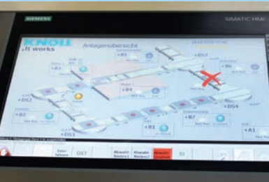
Die Steuerung des KNOLL Montage- und Transportsystems übernimmt eine Siemens SPS. Auf dem Monitor ist das Anlagenlayout abgebildet.