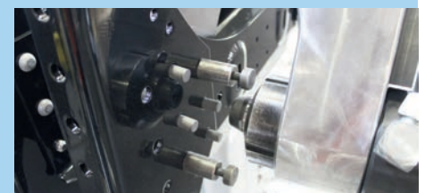
Der wesentliche Montageprozess besteht aus dem Kaltnieten von links und von rechts.