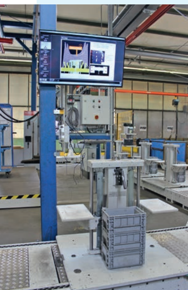
Im „Supermarkt“ wird der Montagebock bestückt. Welche Bauteile benötigt werden, kann der Mitarbeiter auf dem Monitor ablesen.

Als nächstes folgt die Qualitätssicherung. An dieser Station findet eine optische 100 %-Prüfung statt, die derzeit noch von einem Mitarbeiter ausgeführt wird. Anfang 2016 wird eine roboterunterstützte Messstation installiert, die mit einem Kamerasystem ausgestattet ist. Danny Zinßler, Mitglied des Projektierungsteams von KNOLL, ergänzt: „Wir werden dann das Transportband mit der bereits bestellten Hebe-Indexiereinheit ergänzen, die den Werkstückträger abhebt